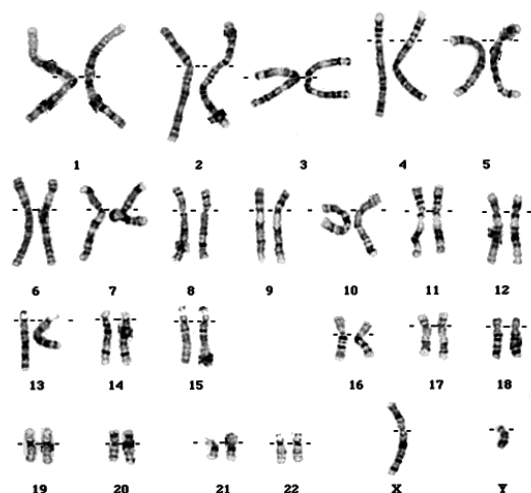
Cariótipo típico de um homem com 22 pares de cromossomo autossômicos e um cromossomo X e um Y.