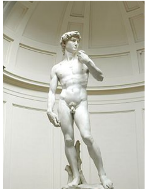
David de Michelangelo.

Estética (do grego aisthesis : percepção, sensação, sensibilidade ) é um ramo da filosofia que tem por objetivo o estudo, da natureza, da beleza e dos fundamentos da arte . Ela estuda o julgamento e a percepção do que é considerado beleza, a produção das emoções pelos fenômenos estéticos, bem como: as diferentes formas de arte e da técnica artística; a ideia, de obra, de arte e de criação; a relação entre matérias e formas nas artes. Por outro lado, a estética também pode ocupar-se do sublime , ou da privação da beleza, ou seja, o que pode ser considerado feito , ou até mesmo ridículo. [1]