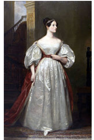
Ada Lovelace, primeira programadora

Durante sua colaboração, a matemática Ada Lovelace publicou os primeiros programas de computador em uma série de notas para o engenho analítico [2] . Por isso, Lovelace é popularmente considerada como a primeira programadora .