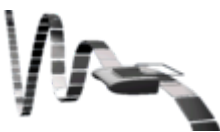
Representação visual da Máquina de Turing

Em 1936 Alan Turing e Alonzo Church independentemente, e também juntos, introduziram a formalização de um algoritmo, definindo os limites do que pode ser computado e um modelo puramente mecânico para a computação. Tais tópicos são abordados no que atualmente chama-se Tese de Church-Turing , uma hipótese sobre a natureza de dispositivos mecânicos de cálculo. Essa tese define que qualquer cálculo possível pode ser realizado por um algoritmo sendo executado em um computador, desde que haja tempo e armazenamento suficiente para tal.