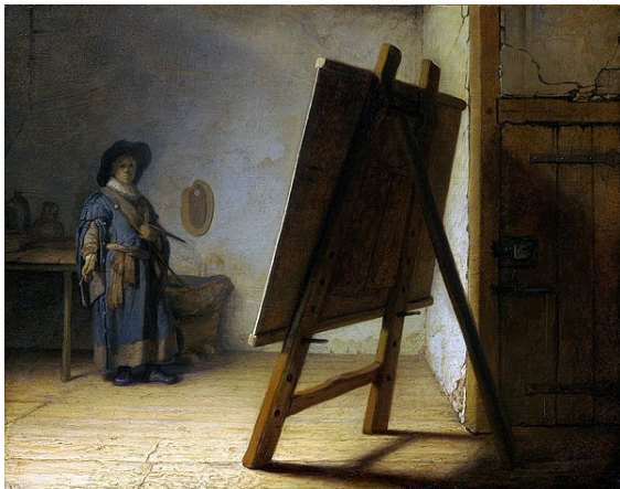
Rembrandt, O artista em seu estúdio , 1626-28. Representação do estúdio de um pintor no século XVII

🔗 Nota: Pintor redireciona para este artigo. Para o profissional de construção, veja Pintor (profissional) . Para outros significados, veja Pintura (desambiguação) . A pintura refere-se genericamente à técnica de aplicar