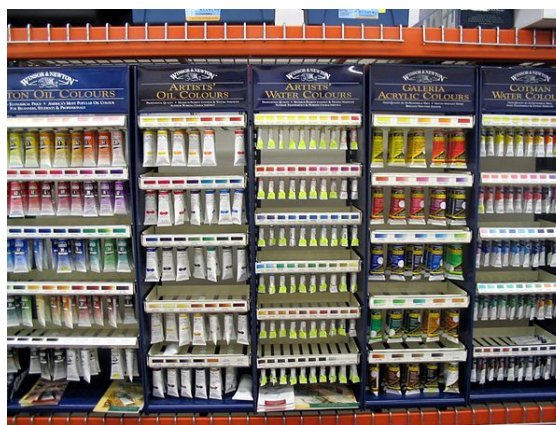
Diversos tipos diferentes de tintas

Toda pintura é formada por um meio líquido, chamado médium ou Substâncias aglutinante, que tem o poder de fixar os pigmentos (meio sólido e indivisível) sobre um suporte.