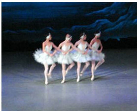
O Lago dos Cisnes