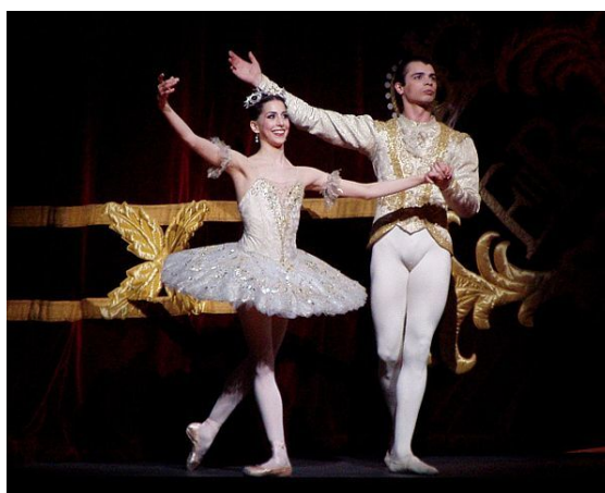
A Bela Adormecida